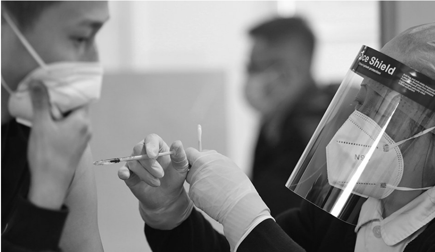
目前,沈阳新冠疫苗接种单位已扩充至300余家。

日前,不少市民对于新冠疫苗的接种存在这样或者那样的疑惑,比如有市民问为啥不建议18岁以下人群接种?这部分人群应该如何做好防护? 董桂华介绍,目前我国已上市的新冠病毒疫苗对于18岁以下人群的临床试验数据还不充分,因此,暂不推荐18岁以下人群接种新冠疫苗。在这部分人群临床试验数据逐步完善后,国家才会逐渐批准、推动新冠病毒疫苗的接种。董桂华说,疫苗是预防传染病的重要手段,但不是唯一手段。“现在18岁以下人群依然应当做好勤洗手、戴口罩、勤通风、一米线”防疫四件套’预防新冠肺炎。”