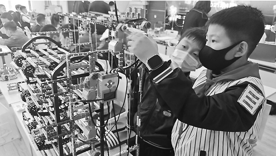
第十三届沈阳青少年机器人竞赛开始,孩子们带着自己心爱的作品参赛。

一旁的另一名选手接着说,他们利用每周日下午的时间,大概准备了两个月的时间,“老师只负责指导,机器人全是我们自己制作的,这款收割机最重要的一个部件