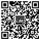
扫描二维码可投稿

同时也邀请群友们能在群里踊跃交流,积极投稿,晒晒幸福、晒晒手艺、晒晒自己的朋友圈。用你擅长的方式,讲述自己的故事!