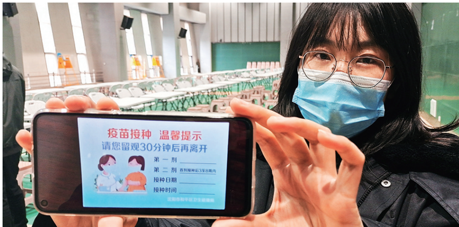
注射疫苗的人将会拿到这张留观卡进入指定区域观察半小时确认。

日前,沈阳市和平区新冠疫苗方舱式集中接种点已准备就绪。只待疫苗到位,即可开始接种工作。