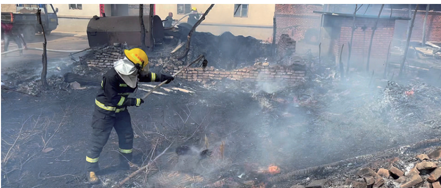
消防人员及时赶到将明火扑灭,又处理阴燃的柴草。

大风天,农户家200多平方米的饲料堆垛起火,且火借风势,引燃了农户仓房内的玉米芯,逼近民房,随时会造成“火烧连营”的惨状,朝阳消防及时赶到,奋战1个多小时把火彻底扑灭。