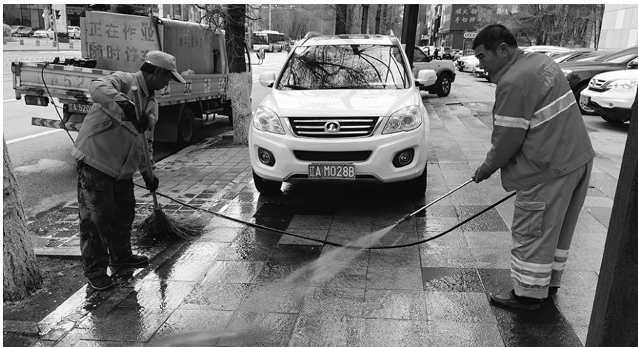
记者联系环卫部门,进行油污处理。