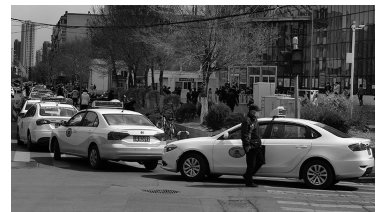
4月16日,沈阳铁西区滑翔路某医院门前,出租车扎堆儿占用机动车道等客。