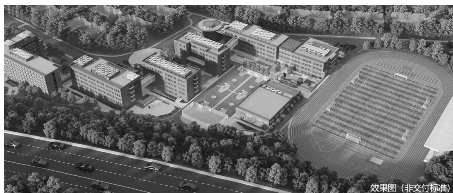
效果图(非交付标准)

曹淑君,正高级教师,全国先进工作者、全国优秀教育工作者、国务院特殊津贴获得者,辽宁教育年度人物、省优秀专家,市教育专家,市优秀校长、沈阳市人大代表