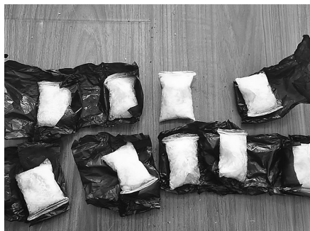
警方缴获的冰毒。

2020年2月28日,沈阳市公安局刑侦禁毒局缉毒一大队在工作中获取一条重要线索:一名绰号为“新哥”的男子在沈阳市内五区、苏家屯区以及辽阳市涉嫌组织贩卖冰毒,交易数量较大,涉案人员众多。