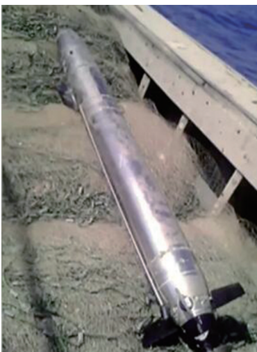
渔民捕获不明装置。

鱼时发现了境外投放的技术监测装置，“直径有碗口大，体积圆柱体，上面有一个浮球，下面通了一个很长的线。”