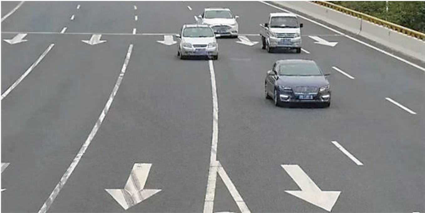
网友航拍实测,在这一路段3分钟竟有27人违章。

近日,广东“佛山一路口 62万车主违章,总罚款超1.2亿元 ”一事被曝光,并引发舆论热议。有车主对处罚提出了质疑。网友航拍实测,在这一路段 3分钟竟有27人 违章。