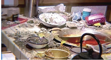
火锅店一块吊顶石膏脱落。