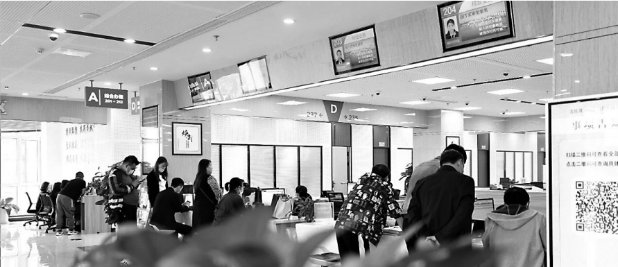
这个审批效能监察系统通过大数据分析,及时对排队人数等数据实时监控。

本报讯 辽沈晚报记者朱柏玲报道 沈抚示范区创新开发了审批效能监察系统,在一面巨大的显示屏上,通过大数据分析,及时对排队人