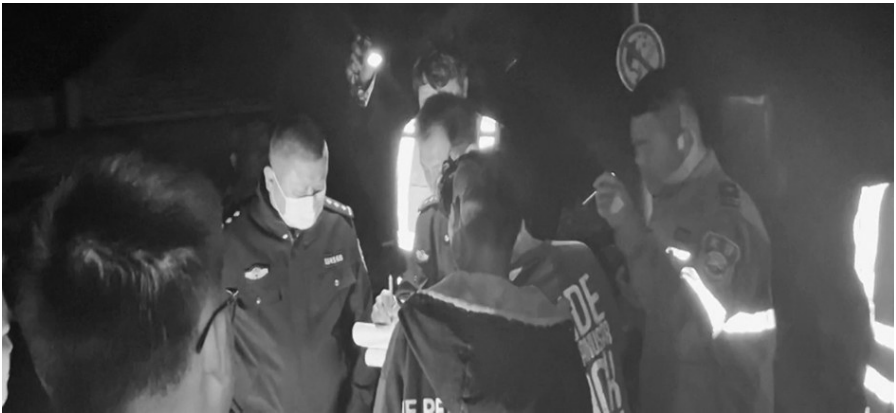
两名被困人员被消防救援人员安全带到山下。