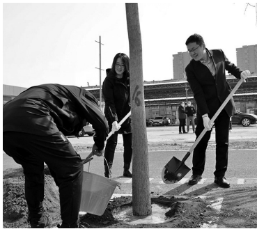
昨日，沈阳市大东区开展义务植树活动。

昨日，沈阳市大东区全民义务植树活动拉开了序幕，在近一个半小时的时间里共栽植行道树国槐120余株。 现场，区委、区人大、区政府(欧盟经济开发区)、区政协四大班子领导及区直机关工作人员120余人，来到北大营街旁新建规划路(北大营海鲜市场原址南侧)，在植树点位开展义务植树活动。现场，有的人挥舞铁铲铲土，有的压实培土，有的扶树浇水，在近一个半小时的时间里共栽植行道树国槐120余株。 据了解，今年大东区将以此次义务植树活动为契机，开展全民义务植树活动，全年全民义务植树，计划栽植乔木2290株、灌木16260株、宿根花卉及草坪28925平方米，花卉10.2万株。 孙若彬 辽沈晚报记者 胡月梅