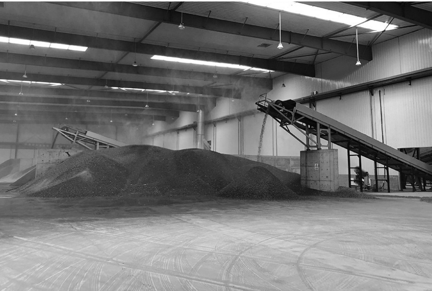
昨日，沈阳建筑垃圾再生利用项目投产，年处理建筑垃圾100万吨。

早在2018年6月，沈阳就出台了《建筑垃圾和散流体物料处置管理规定》，将建筑垃圾收纳场所的建设和综合利用纳入循环经济发展规划，鼓励社会资本投资建设建筑垃圾收纳