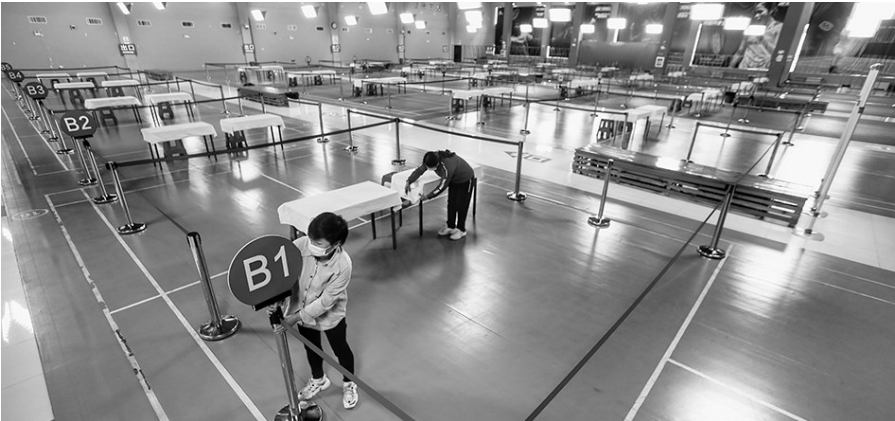
沈阳市大东区新冠疫苗方舱接种点总面积达到4000多平方米,分为上下两层,每层都设置了30个接种台。

按照部署,我省将在预防接种门诊、二级以上综合性医院、临时接种点、集中接种点等多场所推进疫苗接种工作。目前大东区新冠疫苗方舱接种点已经建好。每天的接种量至少达到 6000 针次。其他部分区县目前也都在建设方舱接种点。