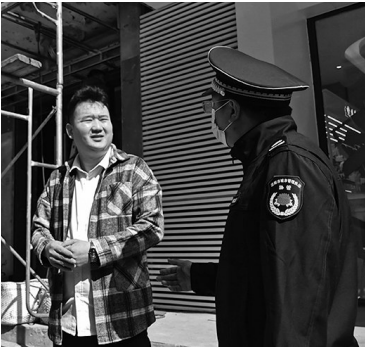
昨日上午,铁西区域管局上门指导商户制做牌匾的标准。

本报讯 辽沈晚报记者张阿春报道 昨日上午,铁西区一家商户门前,一个崭新的牌匾刚刚更换完成。“之前的牌匾已经用十多年了,早就想换一个新的,铁西区执法局市容办的同志主动上门联系我,对牌匾的尺寸、规格进行指导,一天就做完了。节省时间,也没有走弯路。”商户这样说。