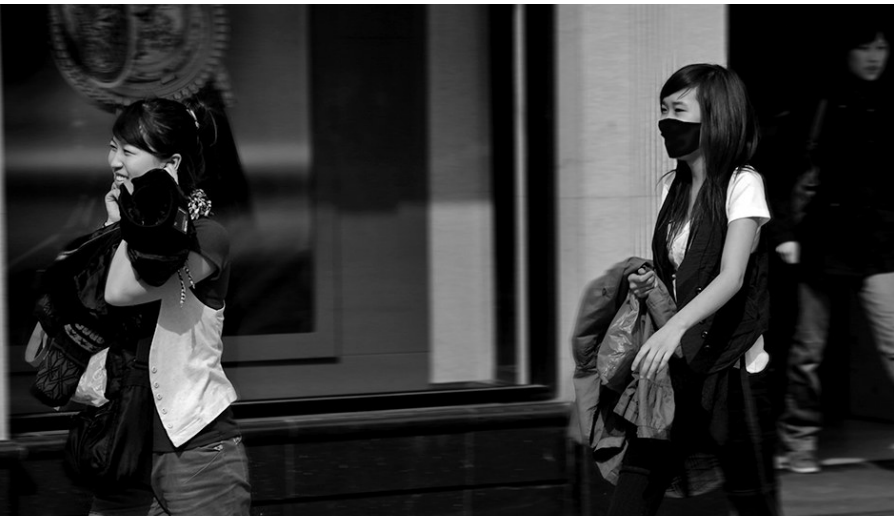
预计本月沈城气温较常年高2℃以上。

气象部门预计4月大部地区降水偏少,气温偏高。全省出现倒春寒的可能性不大,辽西地区可能发生春旱。另外气温回升迅速,持续偏高,又是大风多发季节,全省森林火险等级较高。