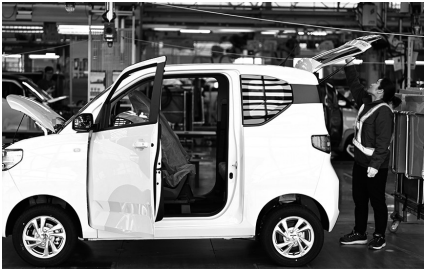
3月8日,在广西柳州一家汽车企业,工人在新能源汽车生产线上忙碌。 新华社发

由于主板和中小板两个市场的估值水平存在差异,市场普遍关注两板合并是否会带来估值变化。 对此,光大证券董事总经理、首席宏观经济学家高瑞东表示,两板之间的平均市盈率有所不同,主要是行业因素导致的,深市主板上市企业以食品饮料、房地产、家用电器等传统行业为主,中小板上市企业以电子、医药生物、计算机等新兴行业为主,当前我国金融市场日趋成熟,市场越来越理性,两板合并后对个股估值的影响相对有限。