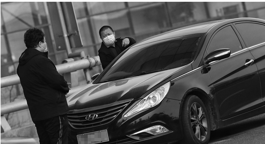
昨日,执法人员在桃仙机场对一辆来自盘锦的涉嫌非法营运车辆进行检查。

梁锋称,对于乘客来说,搭乘黑车也有诸多安全隐患。“黑车多数临近报废期,技术状况较差;驾驶员没有背景审查,身份不明;没有承运人责任险,一旦发生事故商业保险会拒绝理赔。市民如果乘坐黑车,不仅合法权益得不到保障,疫情期间也难以追溯司机和乘客信息。一旦发生事故纠纷,对人身财产造成损失,后续处理也存在难题。” 据介绍,清明小长假期间,辽宁省交通运输