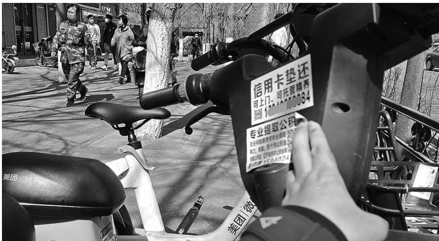
路边许多共享单车都被小招贴贴得“遍体鳞伤”。

黑户贷款、高价收药、刻章、办证，这些小广告利用共享单车使用率高的特点，将其当成了张贴板。对于沈阳市城市精细化管理工程来说，共享单车上的非法小招贴，绝对是有碍观瞻的一块牛皮癣，应当予以根治解决！