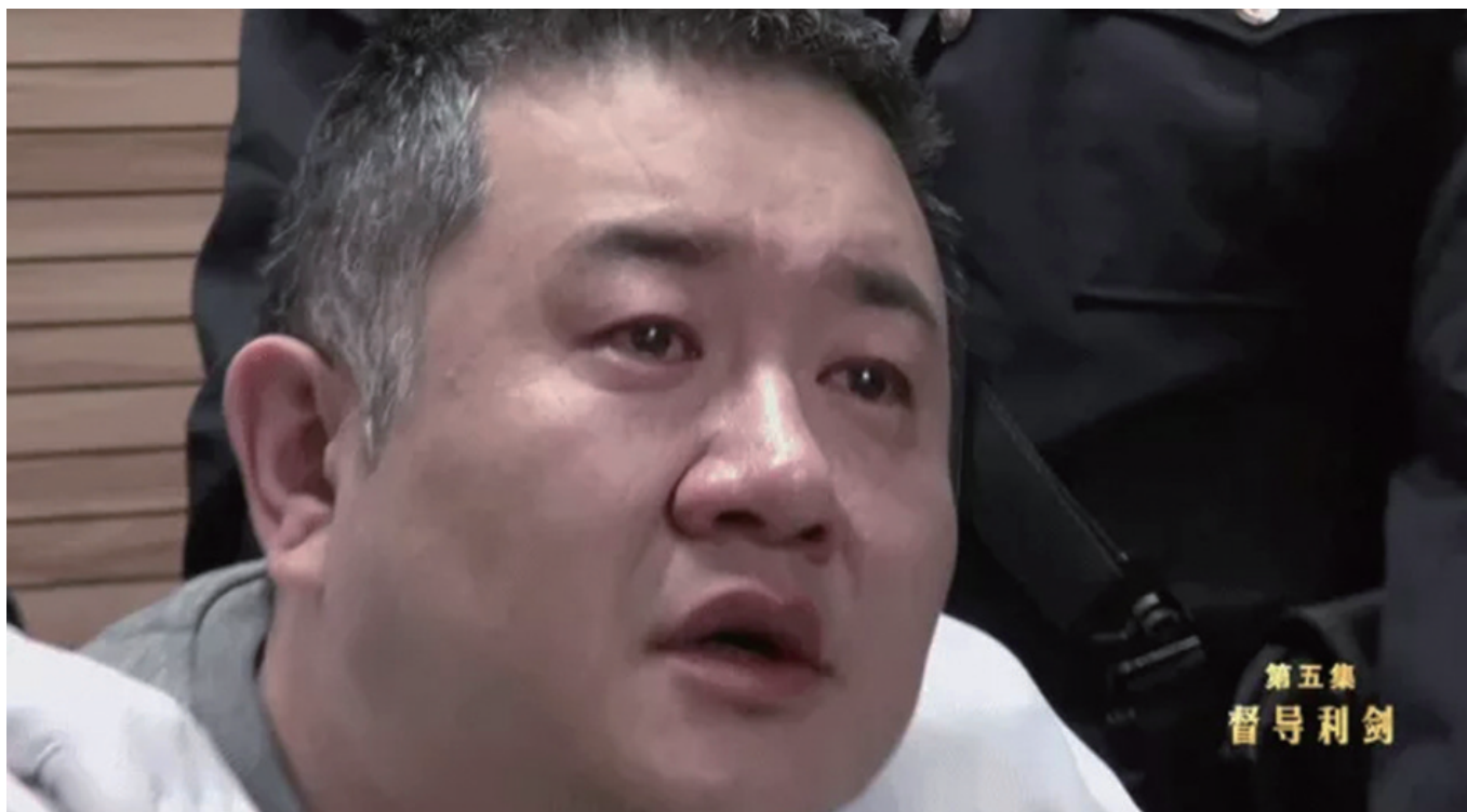
孙小果行刑前流下眼泪。