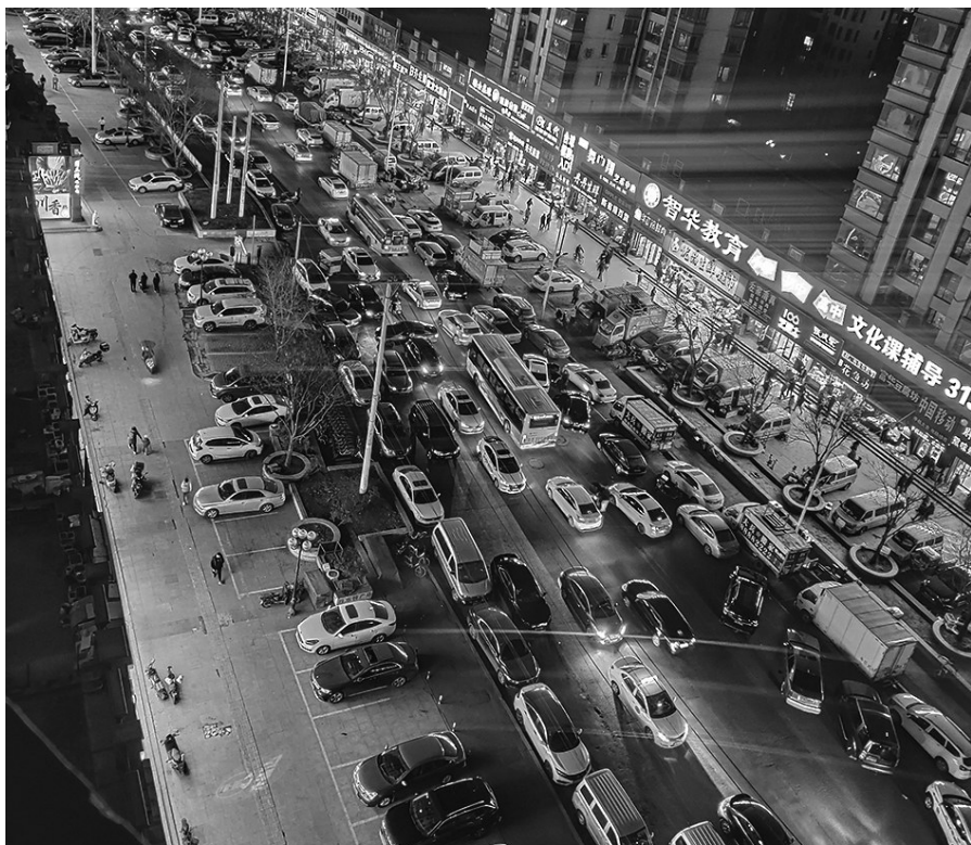
记者实地探访事发地，车辆摆放各式各样，顺向、逆向、横向、斜向，五花八门。

3月29日晚，辽沈帮帮记者在晚高峰时段实地探访该路段，发现汪河南路本来双向六排车道，最严重的的位置被违停车辆占据了三排，给行驶车辆带来了困难，甚至三辆公交车同时被憋停长达10分钟，本就不“宽裕”的路面更加难行。