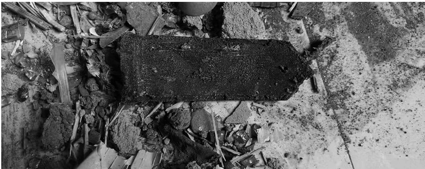
在爆炸现场发现的吕赫光的肩章。

从他到派出所工作到英勇献身只有短短的60天。从警6年多、在派出所60天，他在鸭绿江畔为丹东人民奉献了热情和热血。