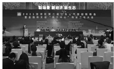
3月30日,沈阳市沈河区第二届服务业开放创新峰会暨金融和文创“两个中心”场景发布大会举行。