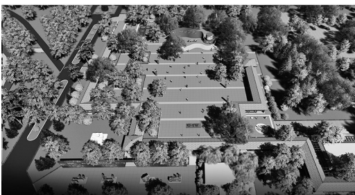
五一劳动广场鸟瞰图