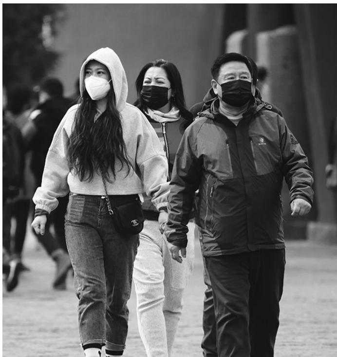
明日全省都是晴朗的好天气,阳光重现。