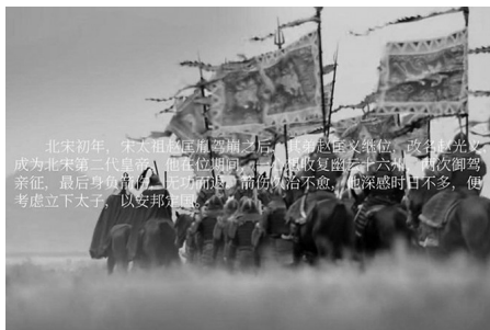
赵匡义继位前就改名为赵光义。