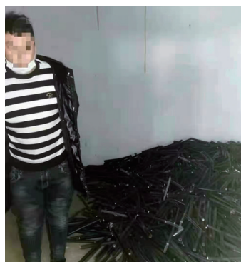
犯罪嫌疑人指认现场。

经反复排查比对,一辆锦州牌照的面包车进入了侦查员的视线,该车辆自2020年11月20日起,多次于下午进入案发现场周围,车上人员下车在案发地附近反复步行,疑似在寻找观察作案目标,然后离开,当日午夜该车辆会再次从市内进入案发现场周围,约一小时后离开现场,在第二天上午该车辆都会出现在外环附近南广路附近。