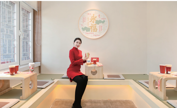
以沈阳故宫万字炕为设计灵感的布局,使人们在喝咖啡的同时可以体验满族居室的东北风俗。

沈阳故宫博物馆馆长李声能介绍,“莊啡”的名字来源于清朝历史上的传奇人物——庄妃,即孝庄文皇后,她“统两朝之养孝,极三世之尊