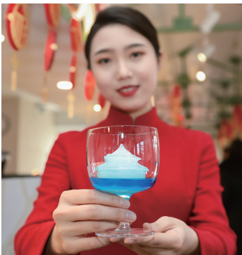
冰饮“政殿之宝”,将椰子果冻做成沈城地标性建筑大政殿的形状,盛入装有蓝色糖浆的杯中,倒入咖啡缓缓搅拌后会呈现别样的视觉效果。

亲”,是历史有名的贤后、清初杰出的女政治家。Logo为繁体字“莊”字外饰八角八边轮廓,创意取自大政殿的八角重檐攒尖式殿顶。