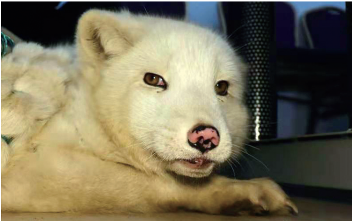
民警将白狐交给野生动物保护人员。