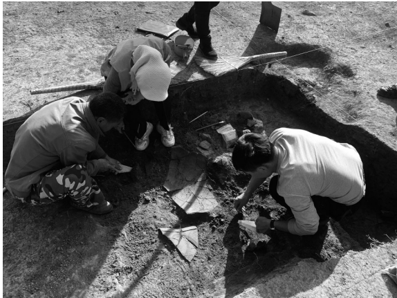
考古发掘工作中。

在本次考古发掘中发现,对T3垫土的解剖确认垫土分为三层,每层垫土上都发现了可复原的陶器。也就是说,这些陶器并不完整,有些只有整器的下半部分、有些只有上半部分,少数