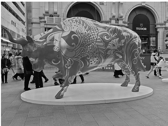
中街网红打卡地红红火火过牛年，吸引八方来客合影。

一个个“福”字，是对新的一年最真诚的祝福；一个个中国结是对新的一年最热烈的期盼。福牛迎春，福气满满，如今的沈城年味正浓。