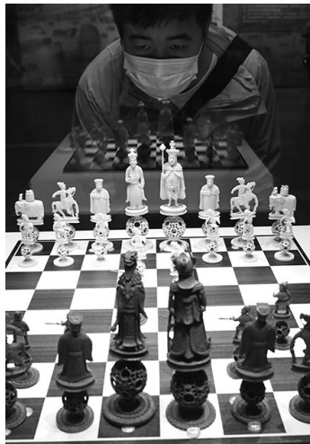
镂空骨雕国际象棋棋子。

18-19世纪，伴随着中西贸易的大规模开展，富有东方情调的瓷器、绘画、扇子、牙雕、漆器、银器等外销艺术品源源不断地销往欧洲，成为欧洲贵族和中产阶层趋之若鹜的时尚用品。其中，外销扇也是最受西方贵族和中产阶级女性欢迎的时尚单品之一，是西方女性服饰装扮的必备之物。