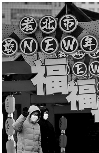
沈城寺庙会浓浓的年味主题。

它是我们办公室窗户上的一个个福字窗花；也是走廊里一排排的中国结；也是电梯内一个个的福字。