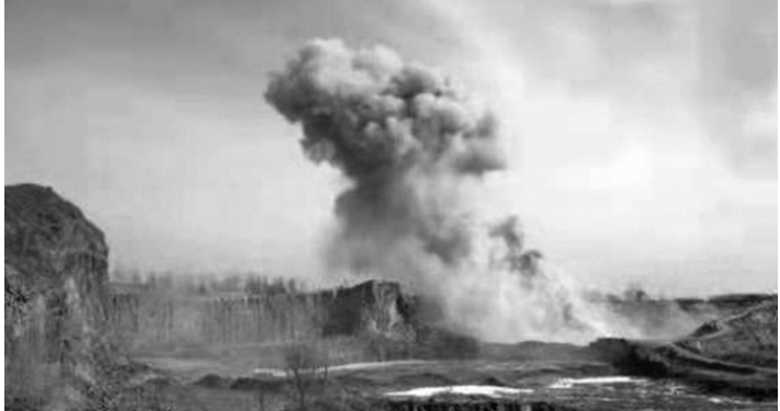
昨日,烟花爆竹被引爆后升腾起一朵巨大的“蘑菇云”。

另外根据有关规定,文物保护单位、交通枢纽、铁路线路和城市运行设施安全保护区内,以及重要军事设施、新闻单位、易燃易爆场所、人员密集的公共场所、城市绿地、山林等重点防火区、10层以上或者高于24米的建筑物等13类场所周边范围内禁止销售和燃