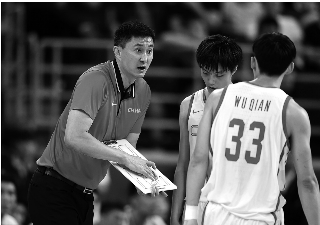
杜锋将正式带领中国男篮开启征途。

团圆的日子,经历了几个月时间隔离封闭的联赛征程,球员与家人的短暂团聚本可以让他们在心理上有所慰藉,但最终留下的12名国家队球员以及教练员将错过这个月家人团聚的珍贵机会。