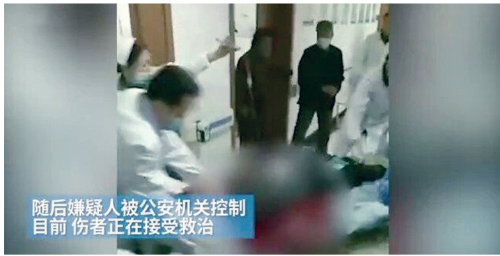
案发时的视频截图。