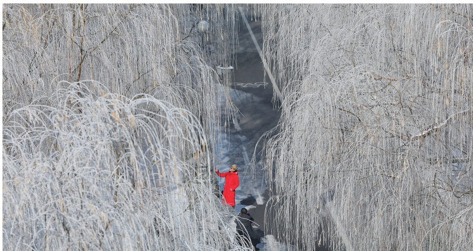
昨日,沈城的雾凇景象赏心悦目,树木银装素裹,吸引眼球。