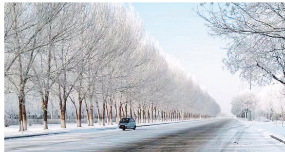
昨日,沈城的雾凇景观美丽如画。