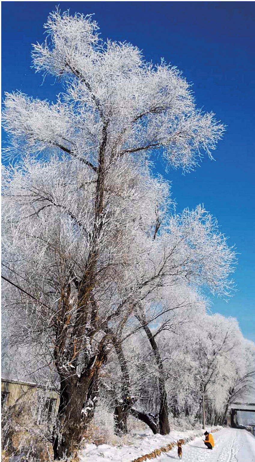
昨日,沈城长白附近呈现一处处美丽雾凇画面。