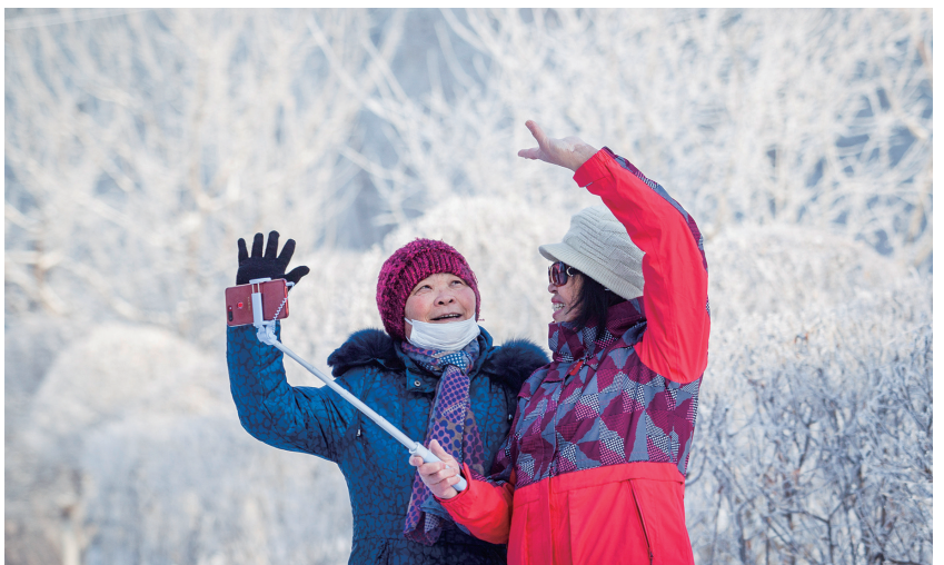
昨日清晨,两位老人用手机自拍雾凇美景。