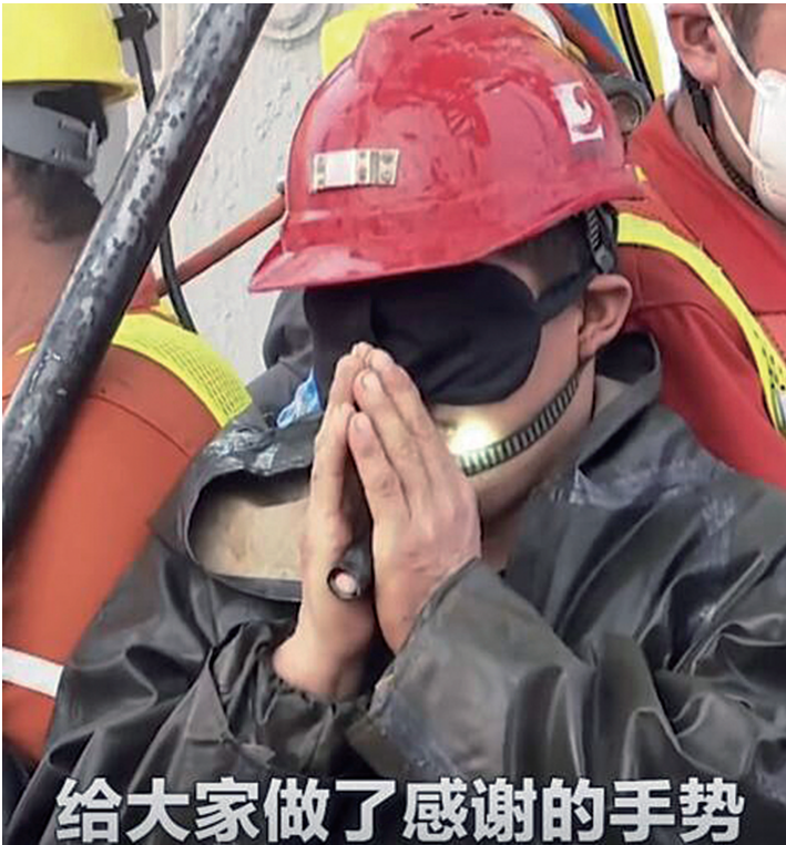
一名矿工升井后,双手合十做感谢手势。

11名被困人员顺利升井,但救援工作还没结束。除此前已确定没有生命迹象的1名被困人员外,目前还有10人处于失联状态。已发现的被困人员升井后,救援人员已开始继续搜救。