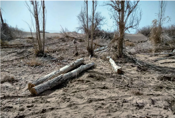
林场内四处可见被砍伐的胡杨树。

1月20日,有媒体报道敦煌万亩沙漠防护林被毁问题。昨晚(1月23日),@人民日报 官微评论道:敦煌阳关林场被指遭“剃头式”砍伐,甘肃已成立调查组。期待查个水落石出,绝不容数代人努力毁于急功近利。“欲守敦煌,先守阳关”,一旦阳关的绿色长城被毁,拿什么护佑敦煌?生态环境保护,功在当代、利在千秋,一定要算大账、算长远账、算综合账! 据《经济参考报》1月20日报道,库姆塔格沙漠东缘,曾经拥有约2万亩“三北”防护林带的国营敦煌阳关林场,如今却基本毁于刀斧,整片林带几乎被砍伐殆尽。阳关林场被砍伐的防护林地全部用来种植耗水量大、需频繁扰动地表土层的葡萄。 据了解,自2000年以来,来自外地的承包户蜂拥进入阳关林场,大面