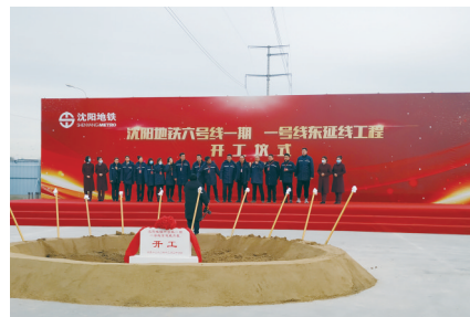
12月26日,沈阳地铁六号线一期和一号线东延线工程开工。