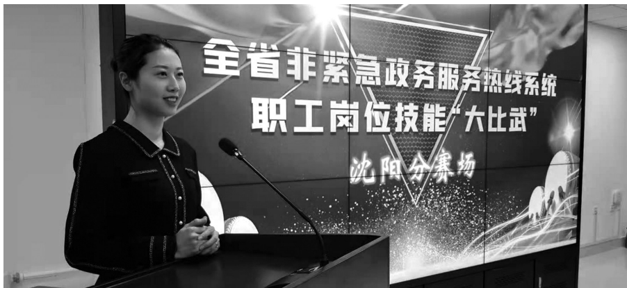
比赛现场选手竞争十分激烈。

12月15日,沈阳、锦州、营口三个片区初赛正式开赛。比赛现场,选手们斗志昂扬,竞争十分激烈。尤其是口语表达环节,各地区参赛选手流畅的表达、饱满的情绪、感人的故事,呈现了高