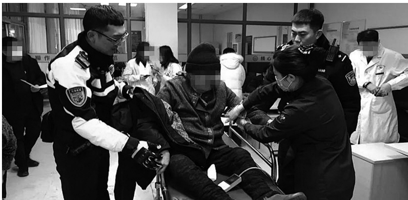
82岁老人被及时送往医院救治,目前已经脱离危险。