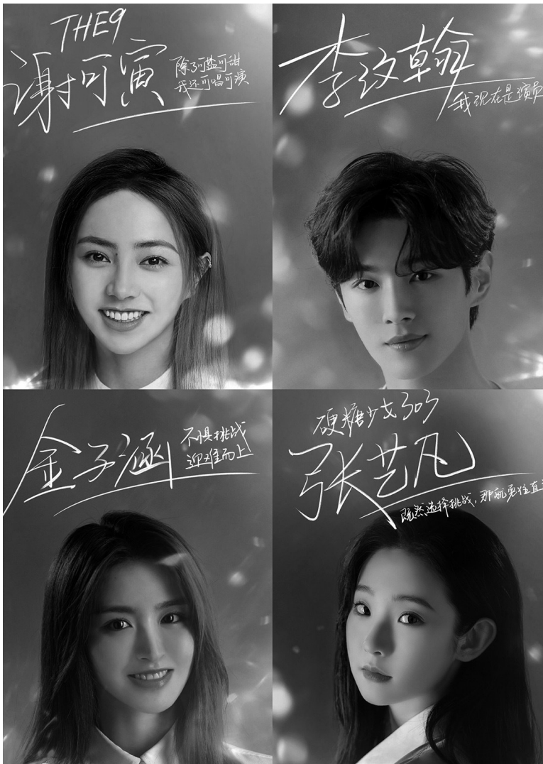
《我就是演员3》部分参赛选手

在业内,综艺的确是许多男团、女团爱豆的出口,他们从偶像选秀比赛中走出来后,如何保持热度是首要难题,综艺资源也是背后公司实力的比拼。不是说不能给他们提供展现自己另一面的舞台,但唱跳舞台还没做到真唱时“脸不红气不喘”,又跑到演技舞台来秀下限,这样真的不好。而《我就是演员》也不应该让自己沦为流量们的工具,“推新”不是遮羞布。