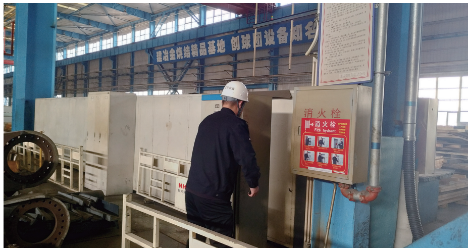
安全生产执法队伍岗位比武大赛现场,参赛队员在“找错”。