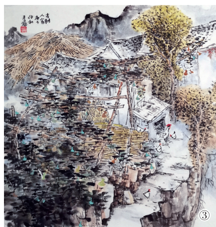
①.卢志学画作《万山红遍》 ②.穆瑞彪画作《苍山叠翠》 ③.王占魁画作《吉财人家》