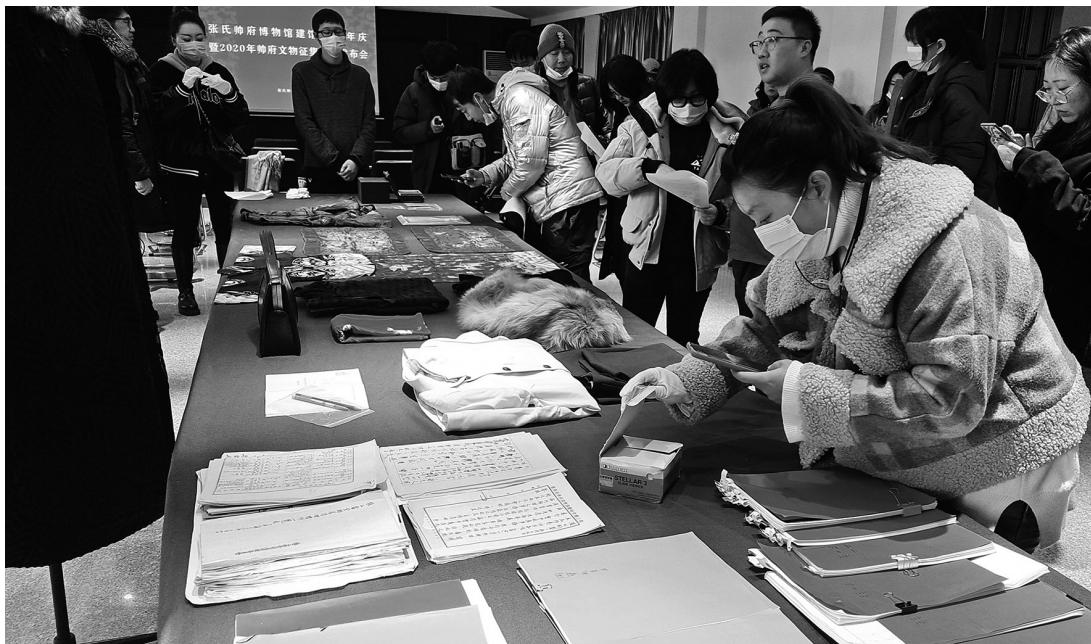
昨日,张氏帅府博物馆建馆32周年庆暨2020年帅府文物征集成果发布会在帅府举行。

这份珍贵的《张三奎堂财产清理工作概况》,揭秘了九一八事变后,日军占领张学良官邸,造成有关张学良的公私财产损失状况。也从侧面反映了张氏家族在东北的财产情况。