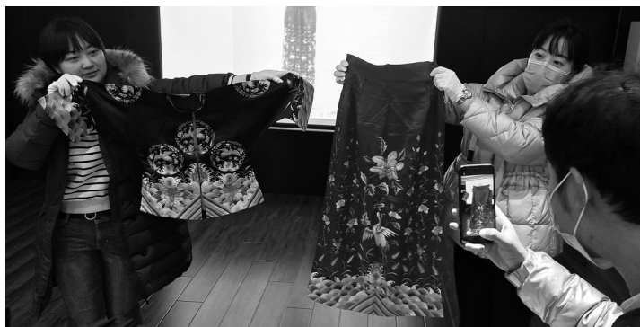
张作霖六夫人黑衣红裳亮相。

在本次发布会上,一份名为《张三奎堂财产清理工作概况》的珍贵资料目录上写着房产、土地、矿权、股票、存款、金块、边业银行清理情形、大元帅铜像收回保管等八个方面。在这个目录的房产下方写着:沈阳市、黑山县、盘山县、营口市、北平市、天津市等字样;土地下方则写着黑山、盘山、抚顺、营口、西丰、沈阳、北平市;矿权下方则记录着八道壕、兴城富儿沟、铁岭、海城马耳峪、西大