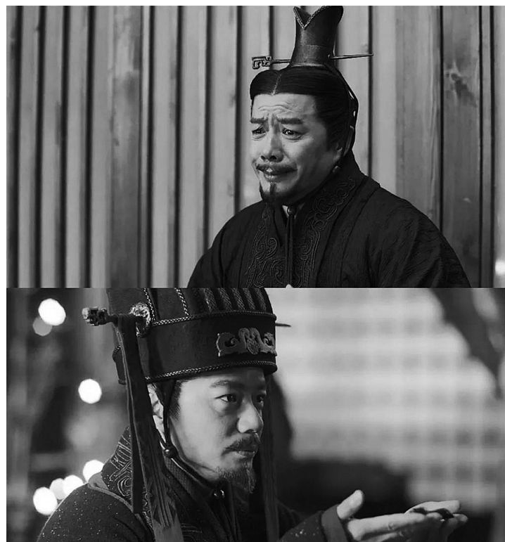
这一版吕不韦有更丰富的层次。