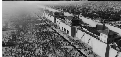
战争场面更是依据于古代兵书的排兵布阵。