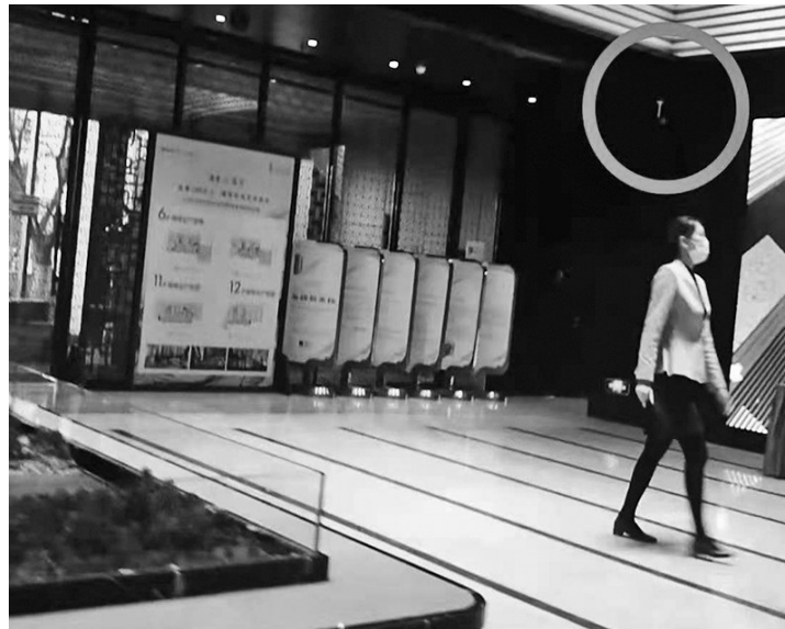
越秀星汇云锦售楼处置业顾问称,沙盘旁(画圆处)的白色探头可采集到购房者的人脸信息。 视频截图