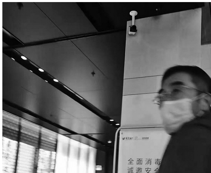
当看房者在越秀星汇云锦售楼处作登记时,上方的视频探头就在采集购房者人脸信息。 视频截图

近日,全国部分城市开始对房企采集购房者人脸信息行为叫停,而沈阳部分房企依旧“看”脸卖房。