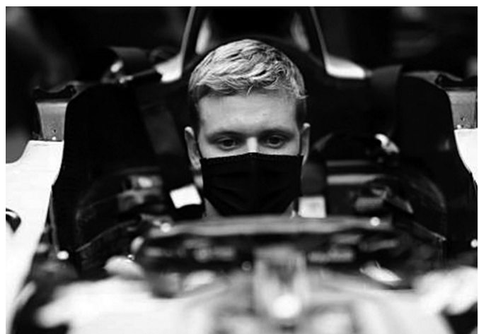
米克·舒马赫将带着父亲的荣耀和压力,坐进F1驾驶舱。 据澎湃新闻

世界一级方程式(F1)哈斯车队2日宣布,七届F1车手总冠军迈克尔·舒马赫之子米克·舒马赫将在2021赛季代表哈斯车队征战F1赛场。