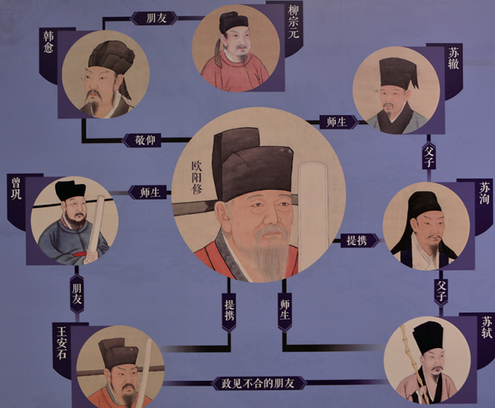
唐宋八大家关系图。

谈到“唐宋八大家”与辽宁的渊源，就要首先说到自称郡望昌黎的韩愈了。 韩愈自谓郡望昌黎，世称韩昌黎。其中，“郡望”一词，是“郡”与“望”的合称。“郡”是行政区划，“望”是名门望族，“郡望”连用，即表示某一地域范围内的名门大族。而韩愈世居昌黎，故又称韩昌黎。在唐以前，锦州的义县古称昌黎。在这里，昌黎指的就是现在的锦州义县。 苏辙曾到过辽宁，元祐（1089）翰林学士苏辙作为贺辽国生辰使出使辽国，曾在辽惠州（今辽宁建平）停留，并有《奉使契丹二十八首·神水馆寄子瞻兄四绝》诗四首寄予苏轼，介绍出使感受、沿途见闻、契丹风俗、民族情感等，尤其强调胡人也格外喜爱苏轼，是北宋民族交往史上值得书写的一笔。