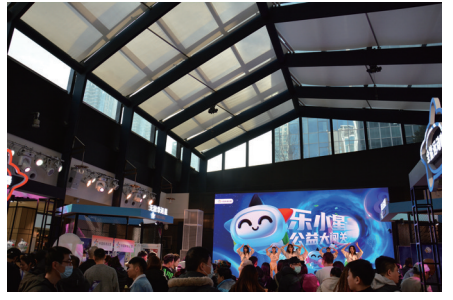
活动现场，还为新鲜出炉的“乐小星公益形

体彩吉祥物“乐小星”来了！11月29日，“乐小星”现身沈阳嘉里城，为辽沈地区的小伙伴们送上了重重的惊喜和幸运。 “乐小星”公益大闯关是辽宁省体育彩票发行中心精心为家乡父老打造的体彩吉祥物主题落地推广活动，现场互动活动区域包括：无故障幸运星、爱心发射器、行走正能量和全能运动咖。参与现场互动活动，打卡通过3关，就有机会利用娃娃机抓取“乐小星”的萌趣衍生品，包括公仔、卫衣、T恤、帆布包、钥匙链、抱枕等超值好礼。 精彩的游戏吸引了众多周末逛商场市民的参与和互动，大家在参与游戏之余，还争着与萌趣的“乐小星”合影留念。 舞台表演时段，舞蹈表演、魔术表演和互动游戏等演出吸引了不少市民驻足观看。活动现场，还为新鲜出炉的“乐小星公益形