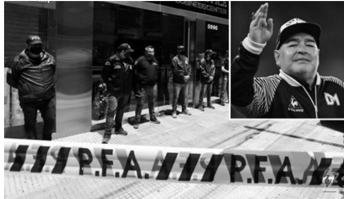
当地警方来到卢克医生诊所调查过程中,诊所所在的大楼外也拉起了警戒线。