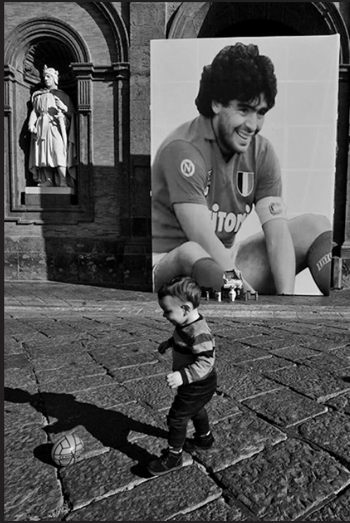
在意大利那不勒斯,一名儿童在马拉多纳的照片前踢球。