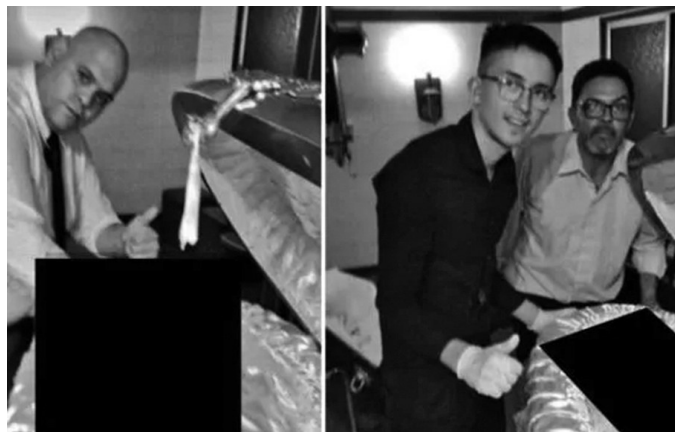
阿根廷几名工作人员与马拉多纳遗体合影。