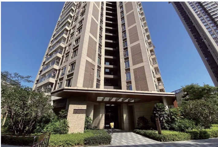
润府一期小区内事发楼栋。