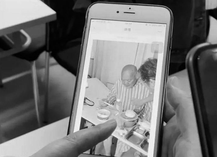
家属展示照顾老人视频。