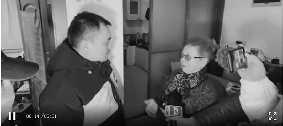
25日,老人亲戚和摊主见面,就媒体报道中有争议的细节进行了沟通。

11月25日晚,记者们随着老人的妹妹及外甥女进入老人家中,老人躺在躺椅上,言语中透着神志不清,略显疲态,他说:“城隍庙要打烊了。” 对着两名家属,老人说:“他们想法和我不一样的,他们要我房子。” 外甥女说:“没人要你房子呀,大家都希望你生活得很好。” 老人妹妹说:“你高兴,你送给谁我们都不说,只要你活得开心,能够健健康康,我们就高兴了。” 老人回答:“情况已经说定了,财