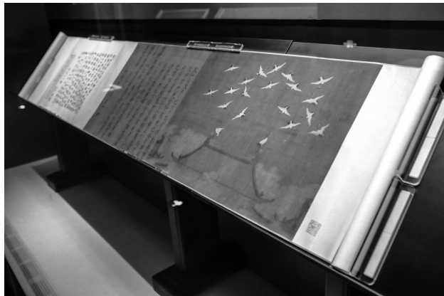
《北宋徽宗赵佶瑞鹤图卷》。

展览分为“文垂千载”“德行笃定”“家国情怀”三个部分，每部分下分若干单元。展出地点为辽宁省博物馆三层20、21、22号展厅，三个展厅展览面积合计3738平方米。展出与“唐宋八大家”主题有关的书画、碑帖拓片、古籍等展品百余部，是“唐宋八大家”主题文物的首次聚集。