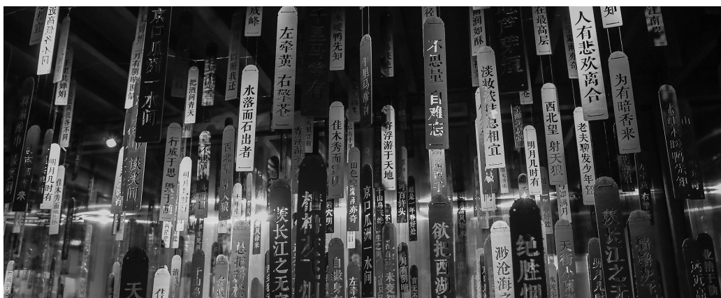
展厅内设置诗牌等打卡地，增加观众互动体验。

为了使观展的观众对展览的融入性更强，本次展览推出了多个互动环节，比如体验拓印、猜灯谜。还设置了触摸屏，让观众对展览及相关知识了解得更多。