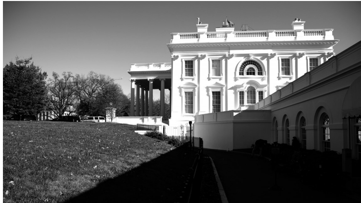
这是11月23日在美国华盛顿拍摄的白宫。