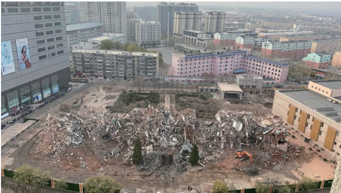
原朝阳市委大院拆除中,这里明年将出现一座城市公园。

民”的工作部署,由朝阳环境集团负责拆除及公园建设工作。16日、17日,环境集团正式对原市委、市政府大院进行拆除。