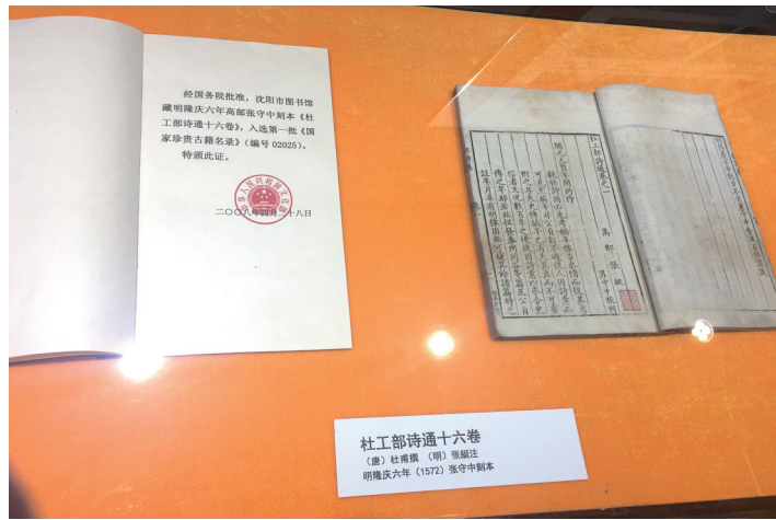
《杜工部诗通》是沈阳市图书馆收藏年代最早的一部古籍。

沈阳市图书馆相关负责人介绍,《杜工部诗通》,亦称《杜诗通》,是沈阳市图书馆收藏年代最早的一部古籍,距今已有四百多年的时间,由唐杜甫撰,明张綖注,明隆庆六年(1572)张守中刻本。同时,这本书也是国宝古籍,2008年,此书入选第一批《国家珍贵古籍名录》。